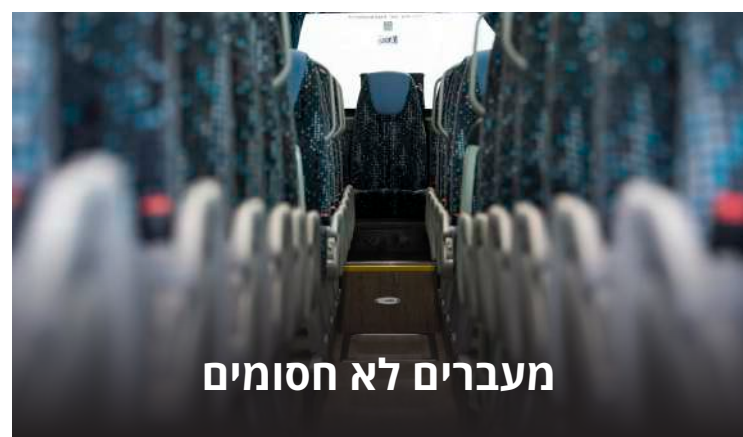
מעברים לא חסומים