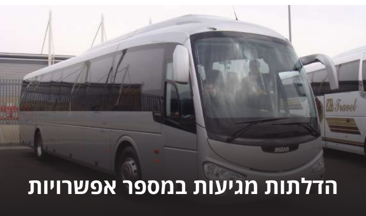
הדלתות מגיעות במספר אפשרויות