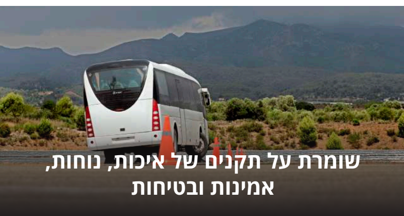
שומרת על תקנים של איכות, נוחות, אמינות ובטיחות