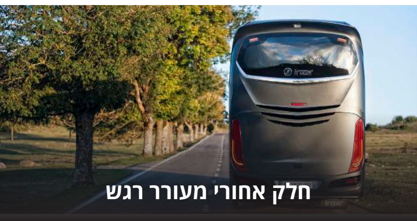
חלק אחורי מעורר רגש