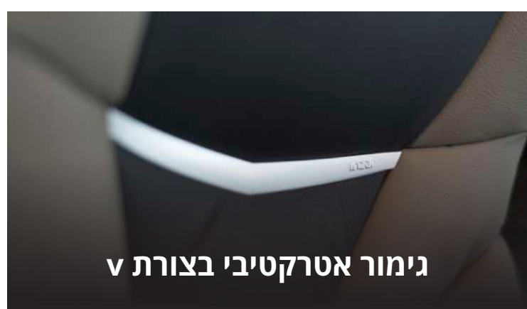
גימור אטרקטיבי בצורת V