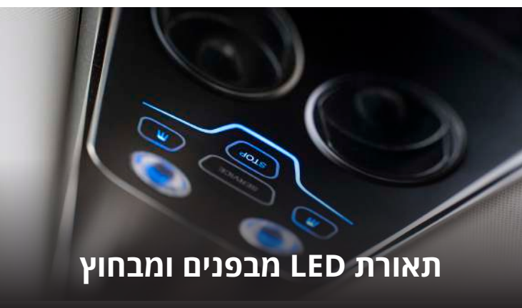
תאורת LED מבפנים ומבחוץ

מערכות סיוע בנהיגה AEB-LDW משולבות על ידי שליטת מסך מגע וקונסולת HMI, מהן מנוהלות מערכות הבידור והנוחות. כדי לספק סביבת נסיעה מושלמת ושביעות רצון של הנוסעים, מתגים קיבוליים בלעדיים במפזר האור ומערכות צריכת האוויר החדשניות בגג ומתחת למרכבה משפרים את ביצועי החימום ואת ביצועי הסרת הערפל מהשמשה.